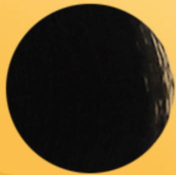
5/73 Châtain clair marron doré