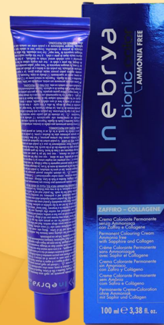
Bionic Color 65 nuances