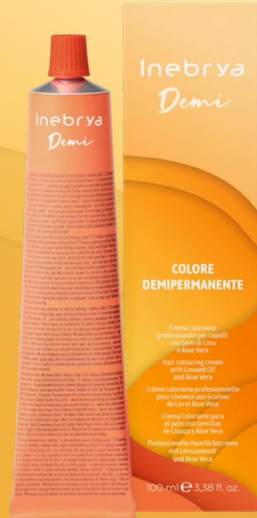
Inebrya Demi 8 nuances