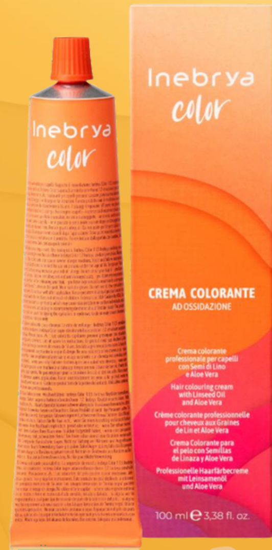
Inebrya Color 118 nuances