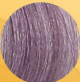
8/75 Blond clair marron acajou