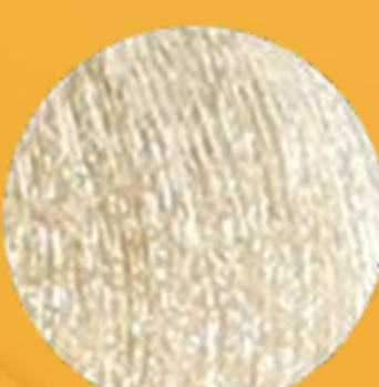
10/01 Blond platine clair pastel cendré

Les nuances peuvent être utilisées individuellement ou mélangées entre elles pour une créativité infinie.