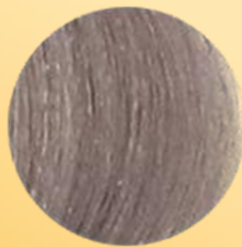
9/2 Blond très clair irisé