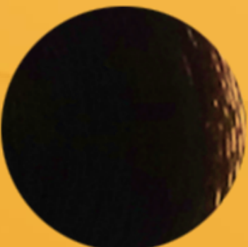
8/11 Blond clair cendré intense