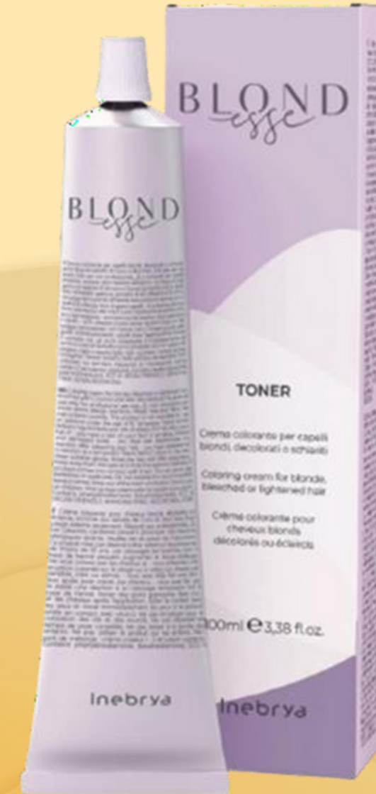
Blondesse Toner 3 nuances